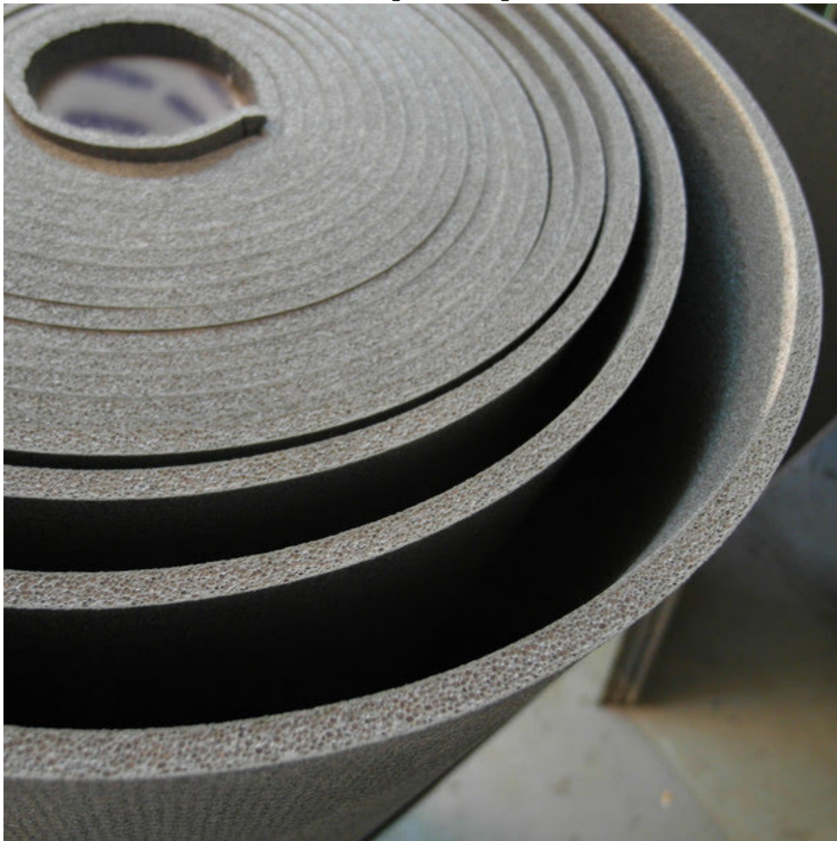
Изолон 300 10мм