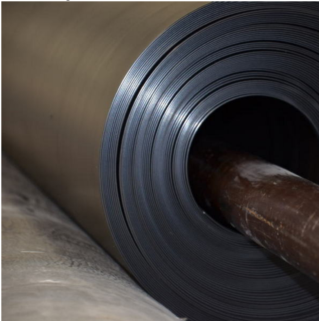
Лист полимерный 2мм Isolon