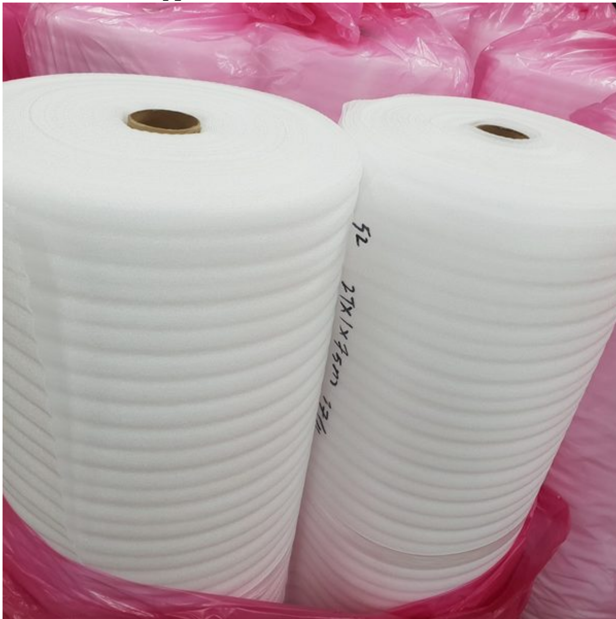
Вомлекс (НПЭ, Изолон 100) толщиной от 2-10мм